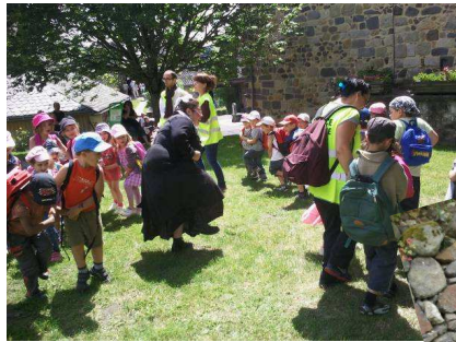
La gigue avec... la Bonne du Curé !