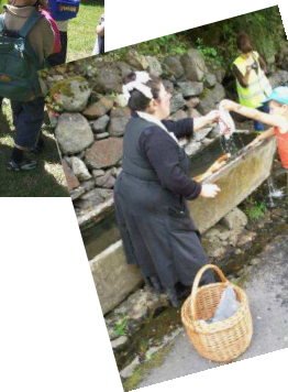
La lessive au lavoir...