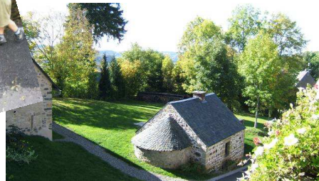
Le pain au four communal...